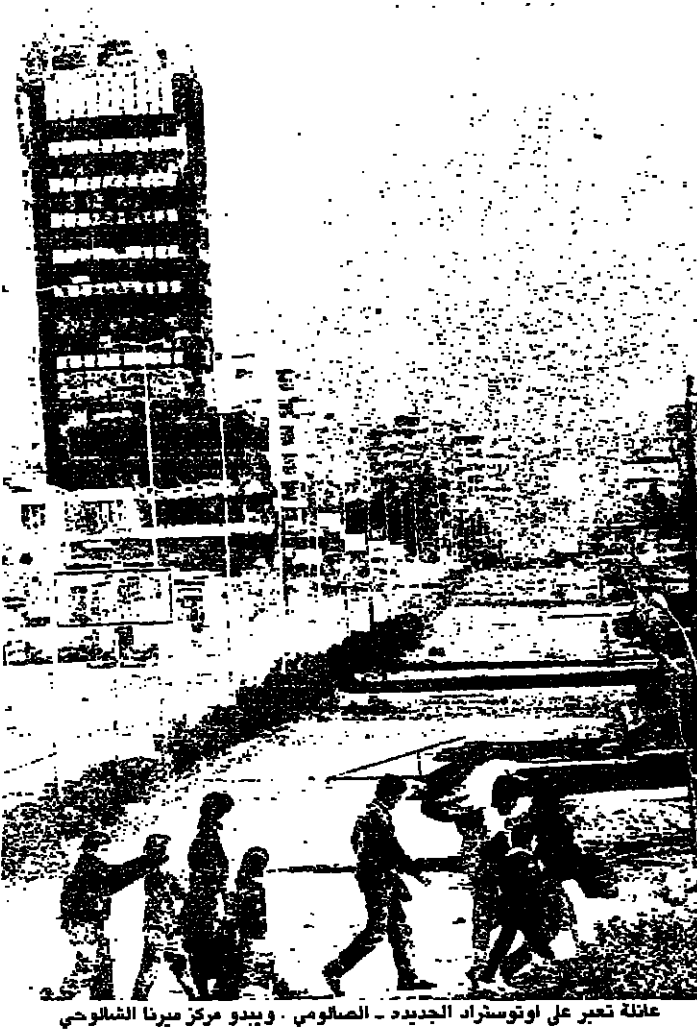
عائلة تدير على اوتوستراد الجديدة - الصالومي - ويبدو مركز ميرزا الشالوخي